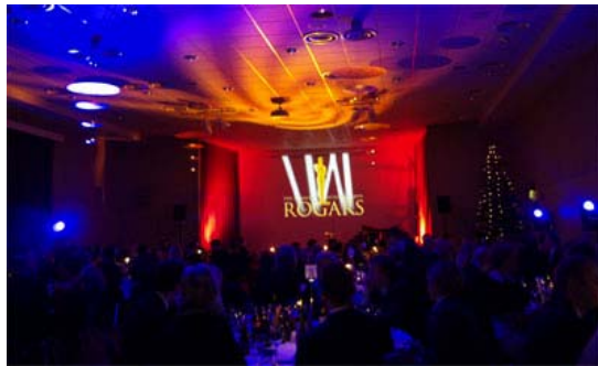
Bilde: Fra julearrangement i Terminus Hall.

Tillegg for oppdekking i eget lokale: lokaleie, lys, blomster, dekor, servitører: kr 65 For selskaper mindre enn 15 personer oppdekking i eget lokale: fastpris kr 1.700 Lukket selskap som varer etter kl 01.00 til dekning av overtid og nattillegg: Kr 2.700